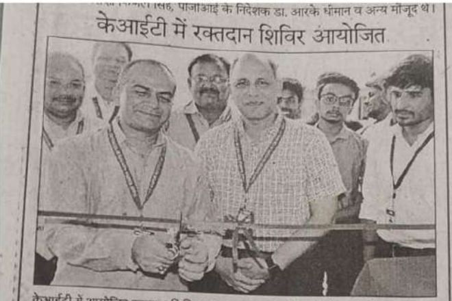
केआईटी में आयोजित रक्तदान शिविर का शुभारम्भ करते प्रबंध समिति के पदाधिकारी।